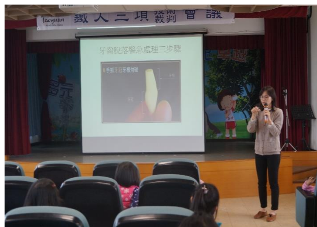
請衛生局護理蒞校宣導牙齒保健及處理